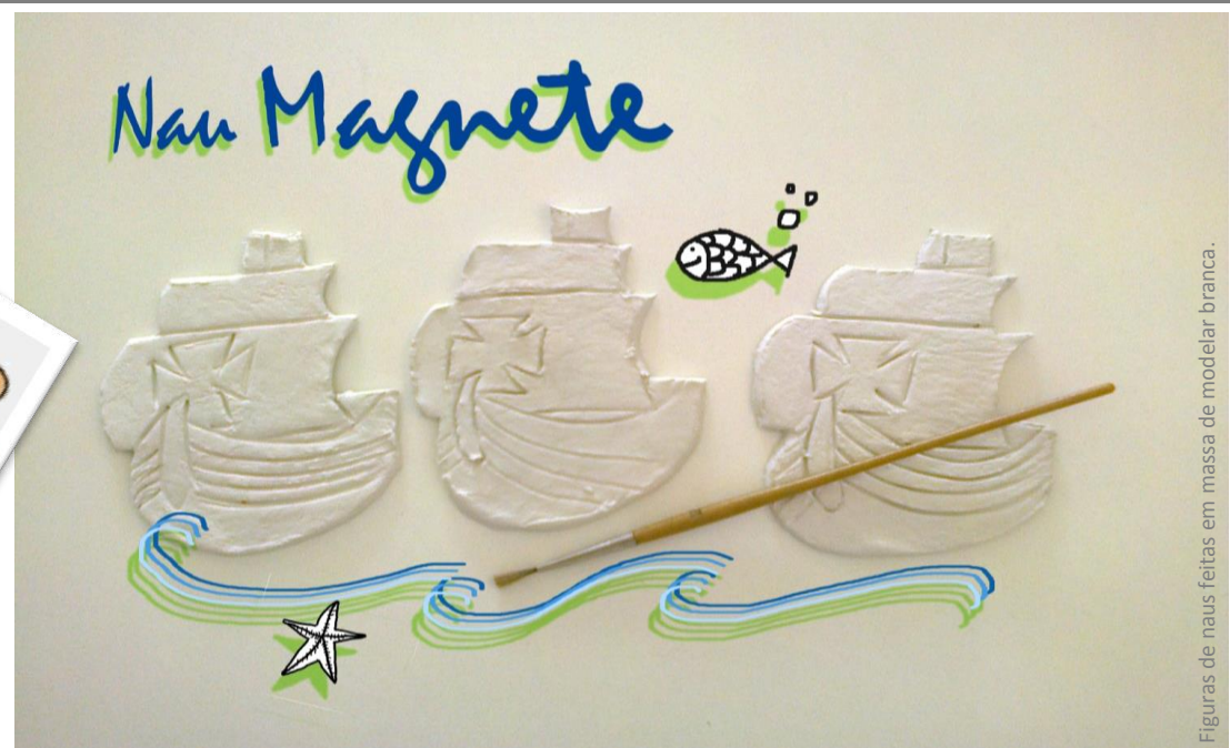
Figuras de naus feitas em massa de modelar branca.

oficina de pintura figura com íman 4 ≥ 6 anos | 3,5€ | 60 min.