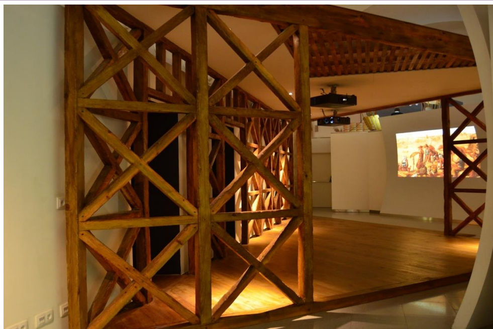
» Estrutura gaiola. Lisboa Story Centre, núcleo XVI.

No conjunto das medidas aplicadas, surgem os primeiros edifícios anti-sísmicos. As paredes de alvenaria dos prédios são erguidas por meio de uma estrutura feita de madeira, mais flexível aos abalos, conhecida por gaiola – uma malha quadriculada de madeira, preenchida por traves cruzadas. A resistência desta nova estrutura a um futuro terramoto é testada com a marcha de tropas.